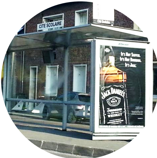
150423-Amiens-Naassila-GRAP sur Twitter / «Double publicité #alcool sur arrêt de bus de la cité scolaire

Mais il pourra aussi être la cible d'autres alcools (bière, whisky) qui vont jusqu'à se disputer son attention sur le même abribus scolaire :