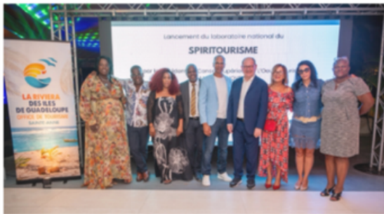
Lancement officiel du Laboratoire National du Spiritourisme Le laboratoire a été inauguré en présence d'Hervé Novelli en tant que Président du Conseil Supérieur de l'Œnotourisme (CSO).

Le 10 avril 2025 – Sous l'impulsion de la Ministre déléguée au tourisme, Nathalie Delattre, Hervé Novelli, président du Conseil Supérieur de l'Œnotourisme (CSO) a officiellement inauguré le Laboratoire National du Spiritourisme en Guadeloupe. Le laboratoire, piloté par l'Office de Tourisme de la Riviera des îles de Guadeloupe avec la participation du conseil Départemental de Guadeloupe, ambitionne de structurer et promouvoir le spiritourisme – qui allie découverte culturelle, patrimoine et savoir-faire autour de la production de spiritueux – sur l'ensemble du territoire français, dans les Outre-mer et l'Hexagone. Les travaux du laboratoire devront notamment permettre de créer le premier Label National du Spiritourisme pour une reconnaissance officielle de l'offre spiritouristique.